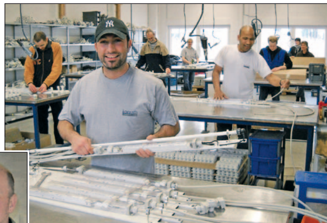
In der Fertigung von Konrath Sonderleuchten arbeiten 20 Mitarbeiter.